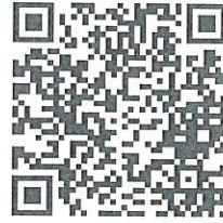
官方 Line 帳號