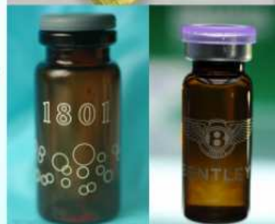
Mephedrone (喵喵)、 bk-MDMA、MDPV (浴鹽) 等安非他命類毒品