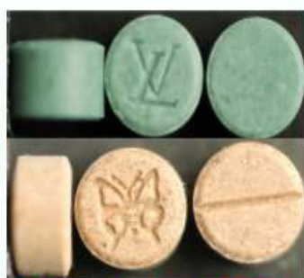
MDMA、MDA、PMMA 等安非他命類毒品