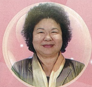
陳菊 / 市長 / 高雄市政府