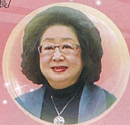
范巽綠 / 局長 / 高雄市政府教育局

時間 ▶ 5/5 (五) 9:30-11:30 地點 ▶ 高雄展覽館 (高雄市前鎮區成功二路39號) 對象 ▶ 全國小學師生家長 (以班級為報名單位)