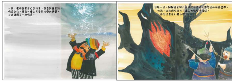
※範例作品：教育部反毒繪本—飄飄王國滅亡記/洪孟真、呂舒婷