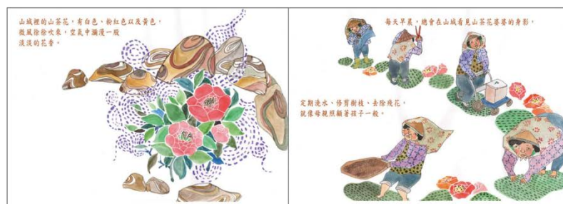
※範例作品：教育部反毒繪本—山茶花婆婆/洪孟真、呂舒婷