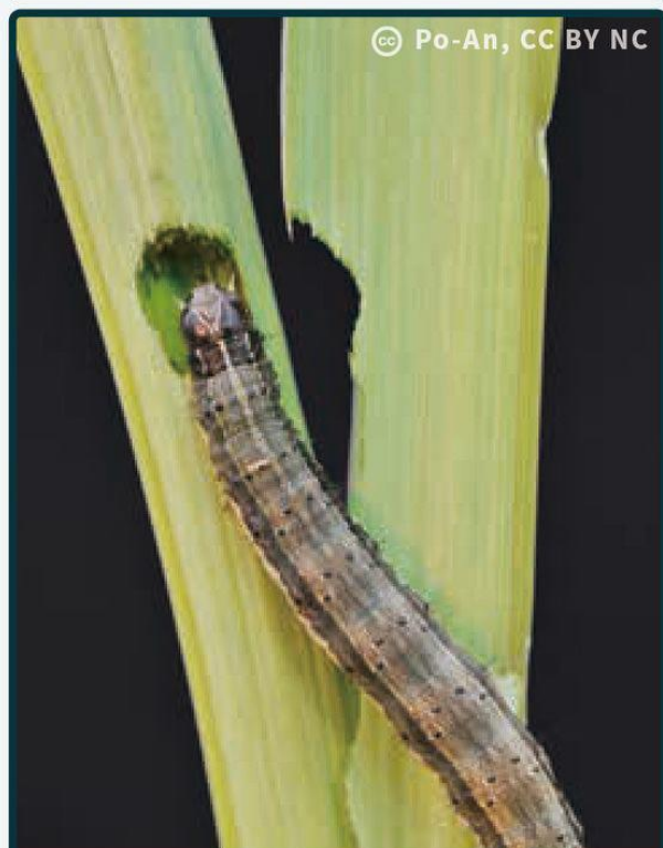
老熟幼蟲蛀食莖稈