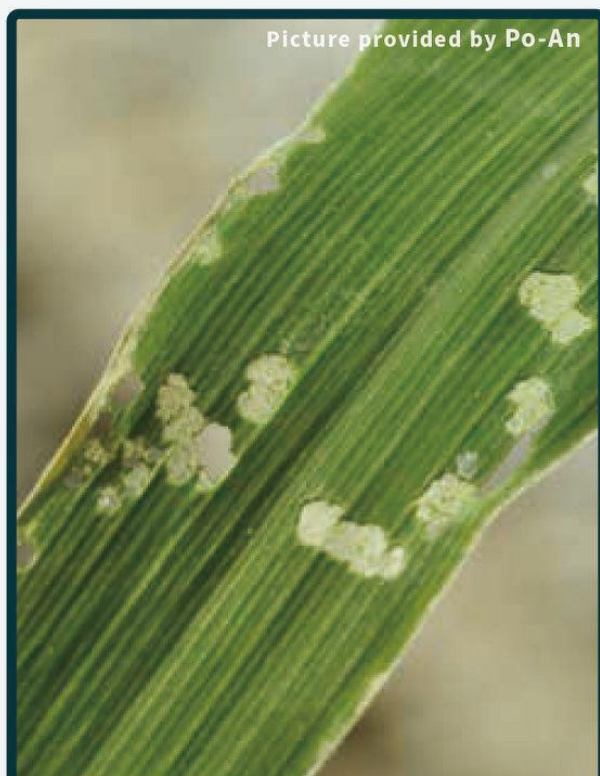
1齡幼蟲造成透明窗格紋啃食痕跡